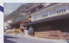
勝山町並み保存地区