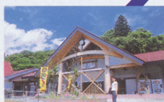
道の駅 メルヘンの里新庄