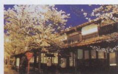
蒜山ハーブガーデン・ハービル