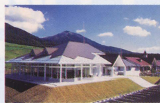
蒜山ジャージーランド