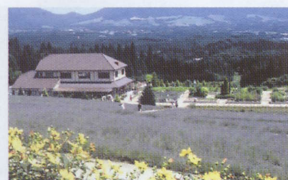
蒜山ハーブガーデン・ハービル