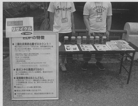
ほっと626露天風呂の日。真庭EDF事業を街頭でPR

現在15件の旅館がこのエコディーゼル燃料を利用している。実際燃費も良く、ロンドンタクシー「ビッグベン」（2,800cc）の場合1ℓ14～15kmという。その上、軽油と違って排気もきれいで空気を汚さない。まさに「空気を