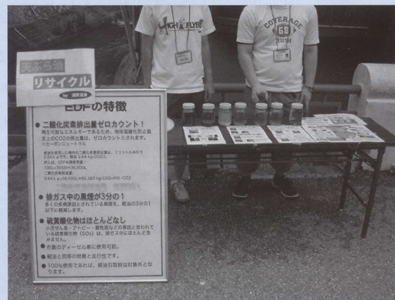
ほっと626露天風呂の日。真庭EDF事業を街頭でPR

現在15件の旅館がこのエコディーゼル燃料を利用している。実際燃費も良く、ロンドンタクシー「ビッグベン」(2,800cc)の場合1ℓ14~15kmという。その上、軽油と違って排気もきれいで空気を汚さない。まさに「空気を