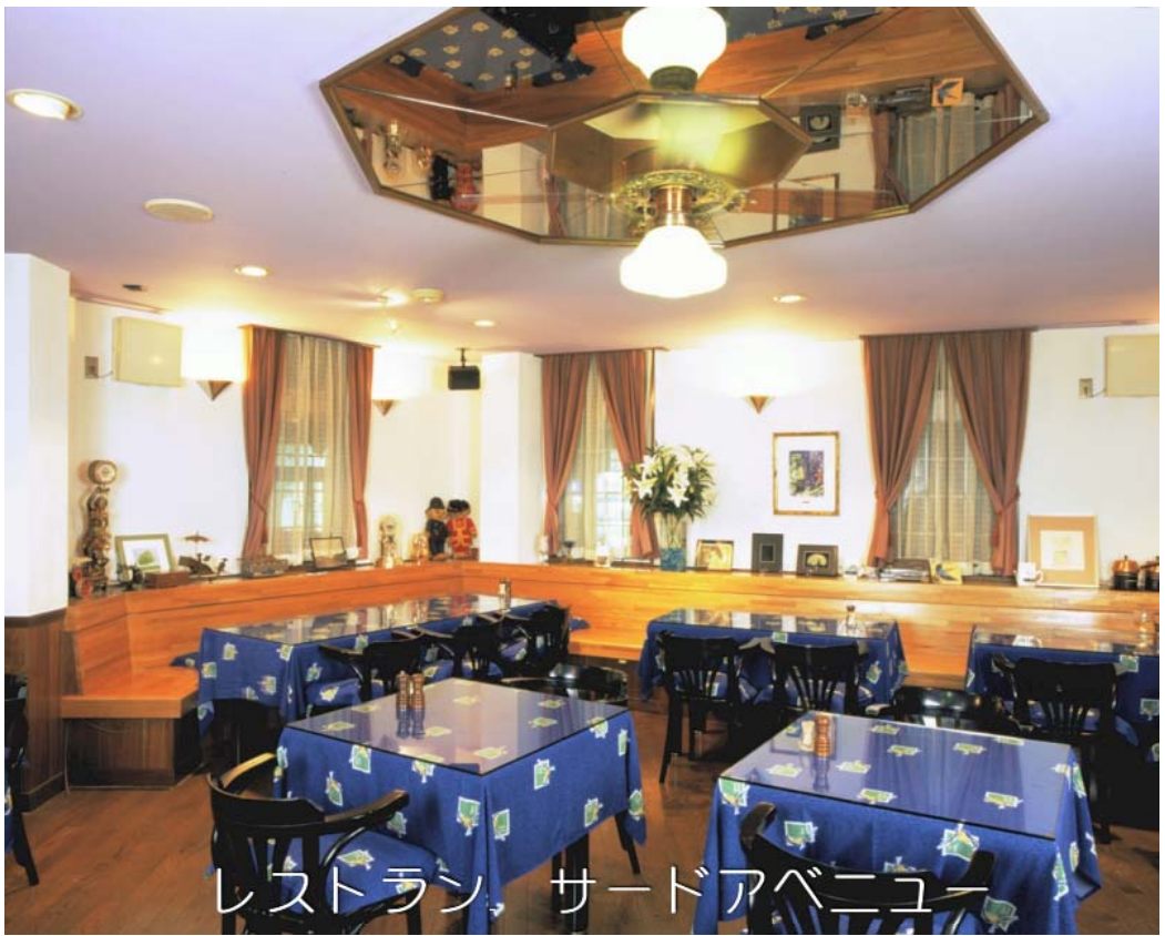
レストラン サードアベニュー