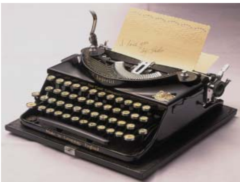
1950年代のタイプライター