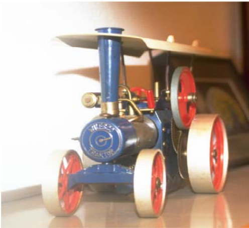
スチームエンジントラクター