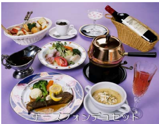
チーズフォンデュセット