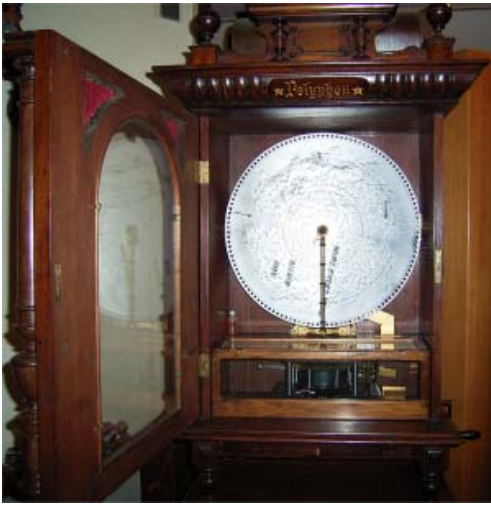
1890年オルゴール「ポリフォン」