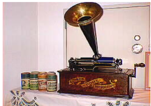
エジソン式ロウ管蓄音機