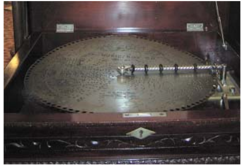
1900年オルゴール「レジーナ」