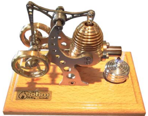
どことなく・・・ハウルの動く城？ スターリングエンジン模型