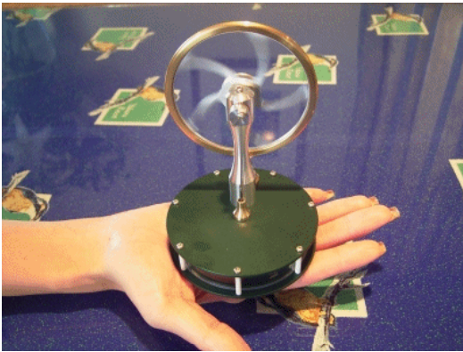
低温度差スターリングエンジン